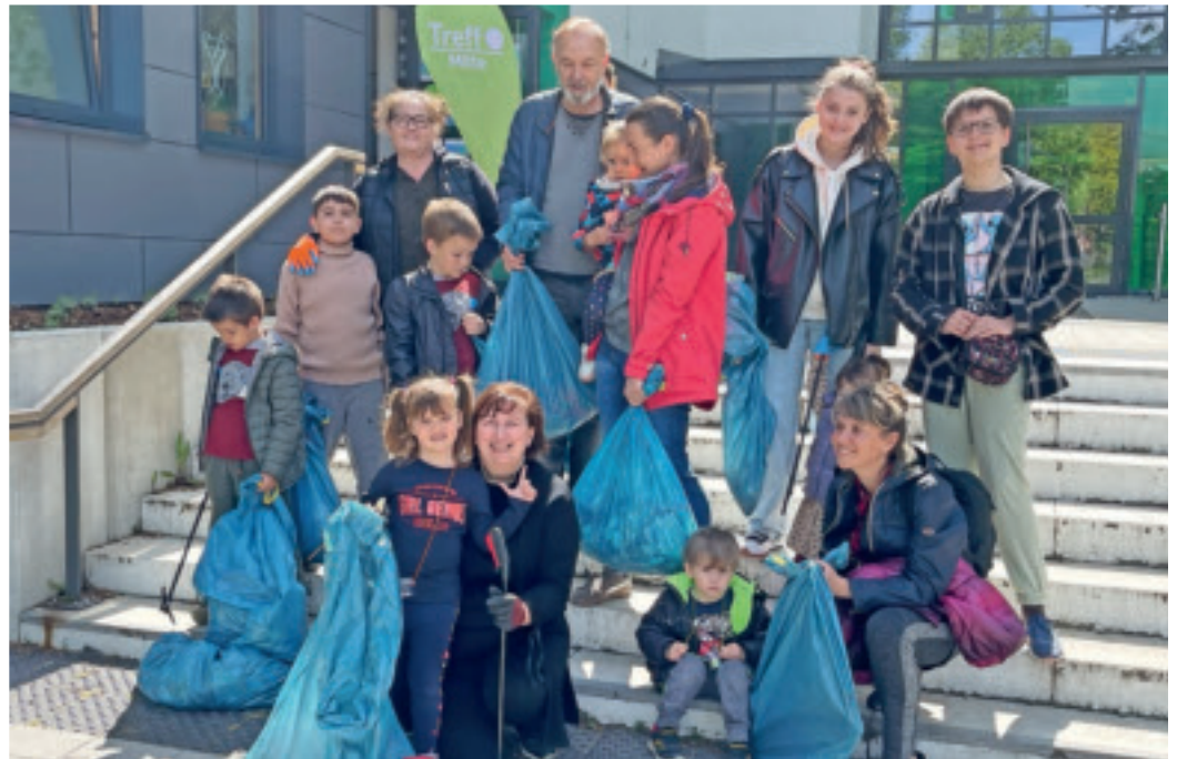
Die Sammelgruppe des Viersener Vereins Sonnenschein bei der Putzaktion im vergangenen Jahr 2022.

Mitmachen können Familien und Nachbarschaften, Vereine und Verbände. Darüber hinaus setzen die Veranstaltenden darauf, dass sich viele Schulen und Kindertagesstätten der Aktion anschließen.