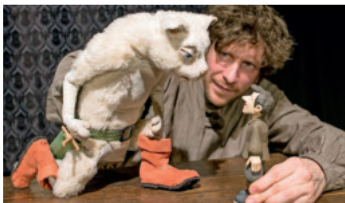
Theater Zitadelle zeigt „Die gestiefelte Katze“.

Die Abendkasse öffnet bei allen städtischen Abendveranstaltungen in der Festhalle um 19 Uhr. Dort gibt es eventuelle Restkarten für den Abend sowie Tickets für die übrigen Abonnement-Veranstaltungen.