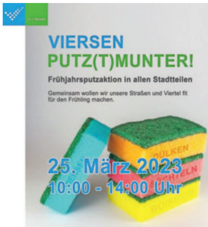
Ein Ausschnitt des Plakates zur Aktion „Viersen putz(t)munter!“

Kontakt: Bürgerverein Boisheim Nettetalter Straße 106