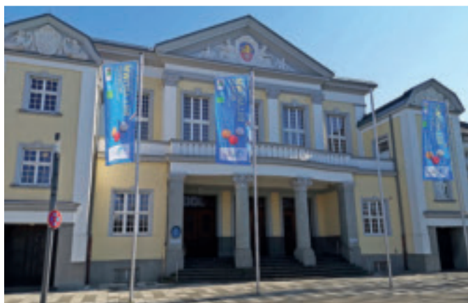
Die Festhalle Viersen wird vom 9. bis zum 12. März 2023 wieder zum „Wimbledon des Billardsports“.

Alle Fotos, Berichte und viele Informationen rund um die Dreiband-Team-WM 2023 finden sich kompakt und übersichtlich auf der Mediapage unter https://billard1.net/dreiband-team-wm-viersen-2023/ .