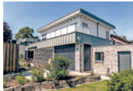
Haus, Anbau oder Aufstockung - mit dem Holzrahmenbau werden den Möglichkeiten keine Grenzen gesetzt.