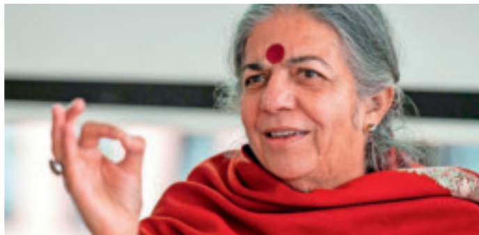
Ein Film stellt die Aktivistin Vandana Shiva vor.

Stadtbibliothek Viersen, Rathausmarkt 1b, Viersen Kann Gemüse verboten sein? Ja, lautet die verblüffende Antwort. Die Deutsche Saatgutverordnung von 1934,