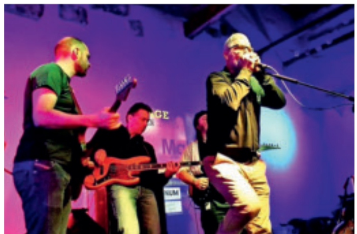
Benefiz-Blues op Kölsch mit der „Köln Kalk Bluesband“ bei Edeka Zielke am Samstag, 18. März.

Bundesweit findet am 17. März die zehnte Nacht der Bibliotheken statt – die Stadtbibliothek Viersen ist dabei.