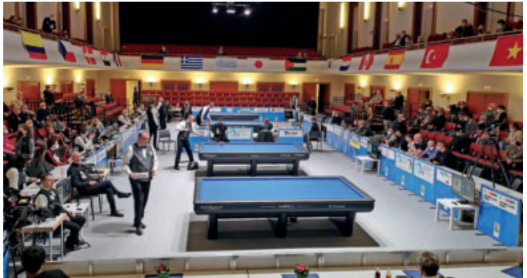
Spannung und großer Sport in der Festhalle Viersen, hier bei der Billard-WM im vergangenen Jahr, als das deutsche Team das Halbfinale erreichte.