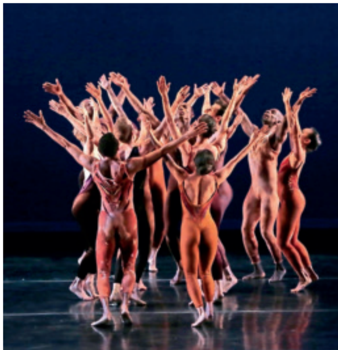
Die Limón Dance Company aus New York steht für dramatischen Ausdruck in technischer Perfektion und mit nuancierter Bewegungssprache.

Märchen-Comedy – So haben Sie Grimm noch nie gesehen, Samstag, 25. März, 20 Uhr, Festhalle. Abo Studio. Einzelpreis 17 Euro.