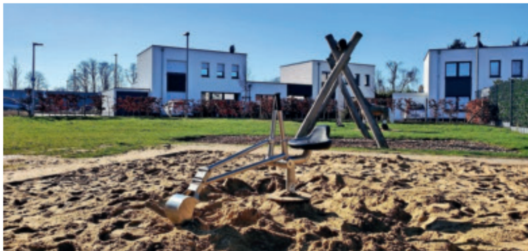
Der neue Sandkasten mit Sandbagger auf dem Spielplatz Wallonischer Ring.

Mitarbeiterinnen und Mitarbeiter der Städtischen Betriebe haben die vorhandenen Spielmöglichkeiten im Stadtgebiet erweitert. In Zusammenarbeit mit dem Jugendamt der Stadt Viersen wurden mehrere Bolzplätze im Stadtgebiet mit neuen Fußballtoren bestückt. Auf Plätzen und Spielplätzen wurden neue Spielmöglichkeiten installiert und vorhandene Anlagen wieder in Schuss gebracht.