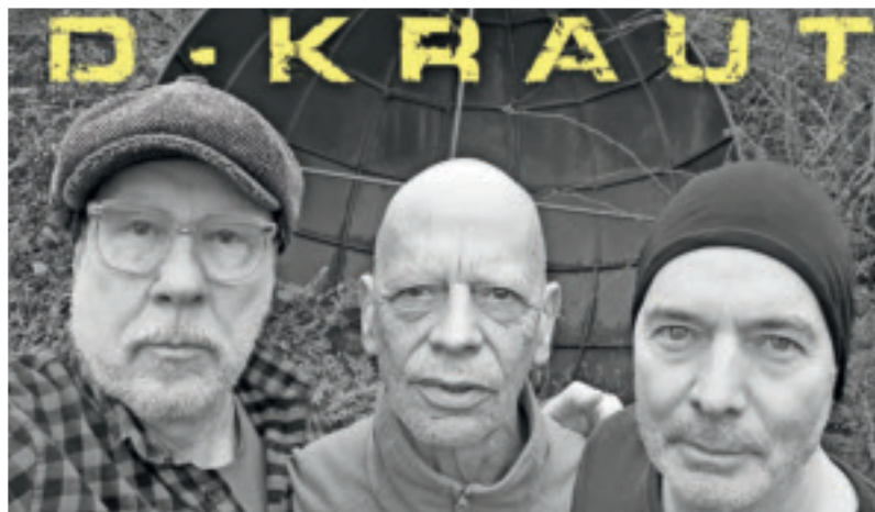
„D-Kraut“ kommt zum Konzert in die Königsburg in Süchteln am 3. März.

Königsburg 2.0, Hochstraße 13, Süchteln (Vorderhaus) info@koenigsburg.org, koenigsburg.org