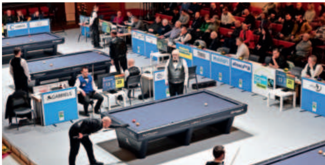
In diesem Jahr darf sich das Publikum erneut auf hochkarätige und spannende Partien freuen. Hier eine Momentaufnahme aus 2023.

Gespielt wird die WM in Vierergruppen, in denen sich die jeweils Erst- und Zweitplatzierten für das Viertelfinale qualifizieren. Deutschland trifft in Gruppe D auf Belgien, Schweden und Ägypten. In der Gruppe A treten die Türkei, Vietnam, Spa-