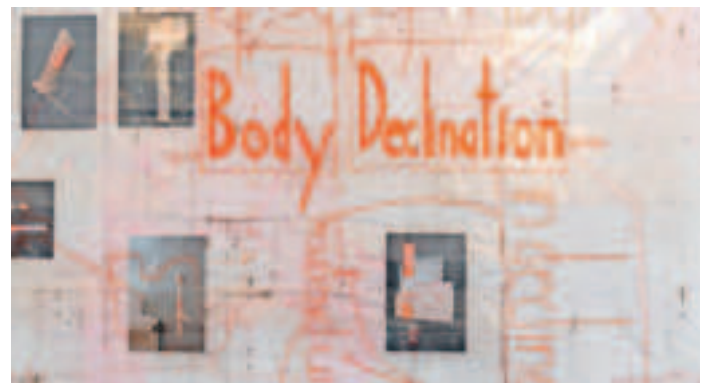
Ein Blick in die Ausstellungsräume der Städtischen Galerie im Park, die zurzeit „Nico Pachali - Body declination“ präsentiert.

Einen Einblick in die Ausstellung bietet am Dienstag, 5. März 2024, 13 Uhr, der Kunst-