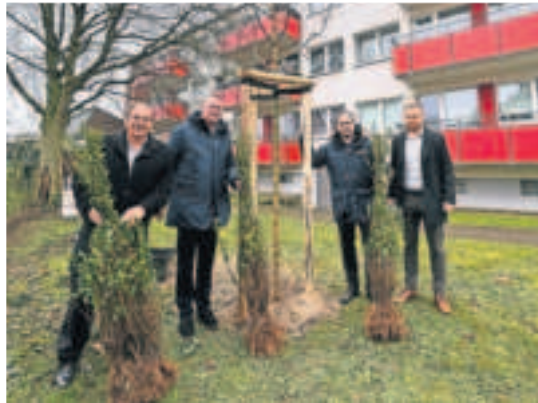
Neue Hecken an der Gereonstraße und Start der Baumpflanzungen mit Baumspende der Firma Erdmann zum 125-jährigen Jubiläum.

Besonders erfreulich: Der Start des Baumpflanzprogramms bestand aus einer Spende der Firma Erdmann, die seit vielen Jahren die Grünflächenpflege auf den VAB Grundstücken durchführt, zum 125-jährigen Jubiläum der VAB im vergangenen Jahr. VAB-Vorstand und die Geschäftsführung der Firma Erdmann trafen sich Anfang Dezember zur Baumpflanzung am Straelener Weg. „Wir freuen uns sehr über diese Spende. Zeigt sie doch,