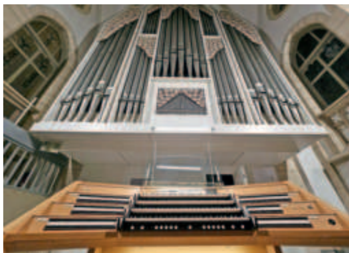
Die Orgel von St. Cornelius in Dülken steht im März als Instrument baulich und klanglich mehrfach im Mittelpunkt.

Bürgerhaus Dülken, Lange Straße 2, Dülken (Sitzungssaal) Stadt Viersen, Telefon 02162 101-0, www.stadt-viersen.de