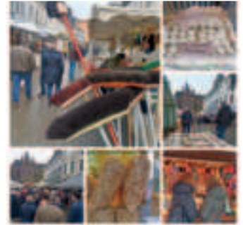
Dülken erlebte einen vielfältigen Schöppenmarkt mit 184 Ständen.

Wer in den Vormittagsstunden des Aschermittwochs in Dülken unterwegs war, erlebte die wiedergewonnene starke Anziehungskraft des traditionellen Schöppenmarktes allerorten: Tausende Interessierte schlenderten durch die Gassen, über den Alten Markt und den Wilhelm-Cornelißen-Platz. Sie ließen sich von der breiten Angebotspalette an 184 Ständen inspirieren, informieren und amüsieren. Das Angebot für Haus und Garten, Kleider- und Schuhschrank und für den großen oder kleinen Appetit war reichhaltig.