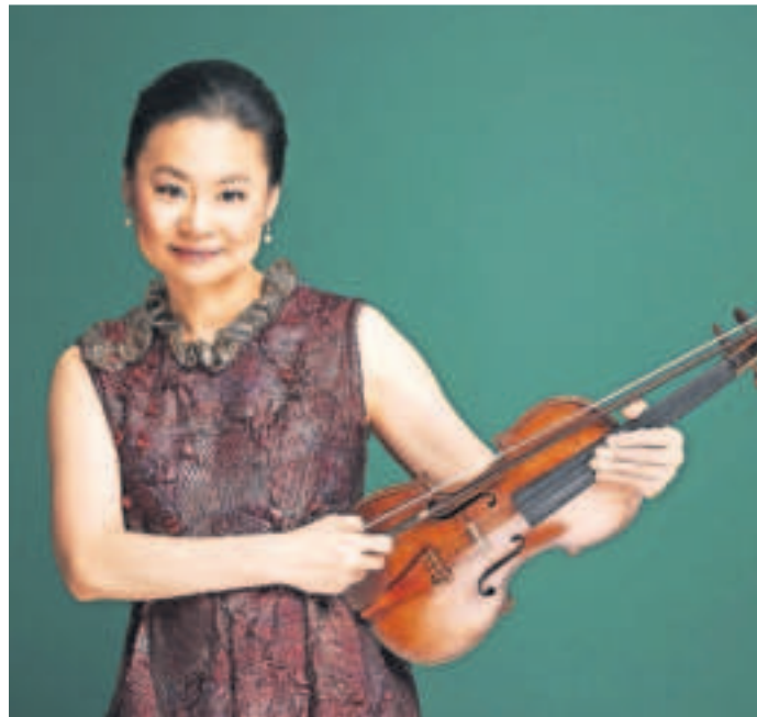
Midori, die visionäre Künstlerin und gefeierte Violinistin, ist am Mittwoch, 6. März, in der Festhalle Viersen zu erleben.

Das Bremer Figurentheater „Mensch Puppe!“ bringt das Stück „Armstrong, die abenteuerliche Reise einer Maus zum Mond“ in Viersen zwei Mal auf die Bühne. Der Sonntagnachmittagsvorstellung am 3. März 2024, 15 Uhr, folgt eine Vorstellung für Schulkinder am Montag, 4. März, 10 Uhr. Die Heldin der Geschichte ist eine kleine Maus. Sie lebt in einer Dachgeschosswohnung. Dort entdeckt