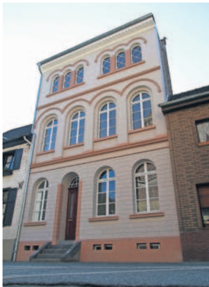
Romanisierende Elemente prägen das äußere Erscheinungsbild des Wohnhauses an der Kreuzherrenstraße 59.

In diesem Straßenzug gab es insgesamt drei Häuser ähnlicher Prägung, wovon allerdings zwei abgerissen wurden. Nicht nur die Fassade, auch die Innenausstattung ist gut erhalten. Im Erdgeschoss sind Stuckdecken mit floralen Motiven erhalten, im Obergeschoss als Hohlkehlmotiv. Die Räume haben ihre ursprüngliche Höhe behalten, die Holztreppe und die Türen mit profilierter Leibung sind ebenfalls unverändert geblieben.