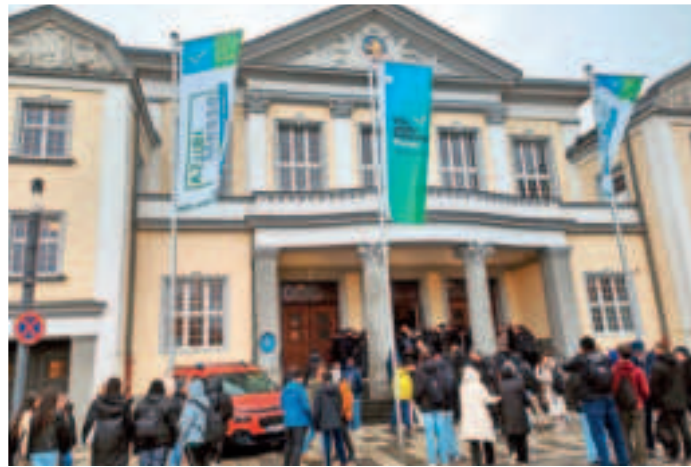
Draußen wie drinnen viel los bei der 3. Ausgabe der Azubimesse in der Festhalle, zu der die städtische Wirtschaftsförderung allein 780 Schülerinnen und Schüler begrüßen konnte.

Am verlängerten Vormittag war die Festhalle für Schulen reserviert. In diesem Jahr hatten sich knapp 780 junge Menschen aus 8 Schulen in Stadt und Kreis Viersen angemeldet. Hinzu kamen einzelne Ausbildungsinteressierte sowie ab 14 Uhr auch Eltern und Großeltern. Sie alle konnten vielfältige Möglichkeiten nutzen, sich im Kontakt zu Unternehmen und Bildungseinrichtungen über Ausbildungen, Praktika und duale Studienmöglichkeiten in der Stadt und in der Region zu informieren.