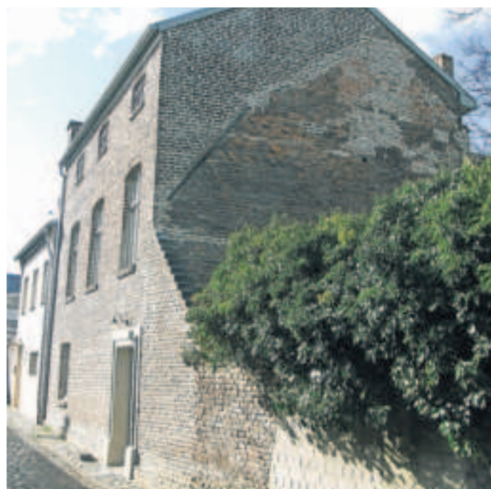
Das ebenfalls weitgehend im Originalzustand erhaltene Hintergebäude ist vom Dülkener Ostwall aus zugänglich.