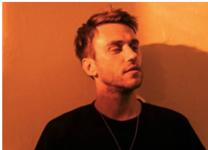
Unterstützt beim Finale am Samstagabend auf Bühne 1 in der Festhalle seine Freunde von Conic Rose: Clueso.