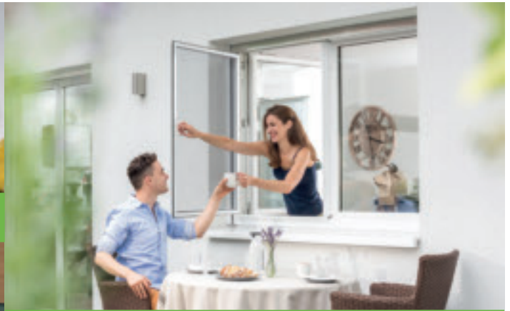
Insektenschutzfenster zum Öffnen