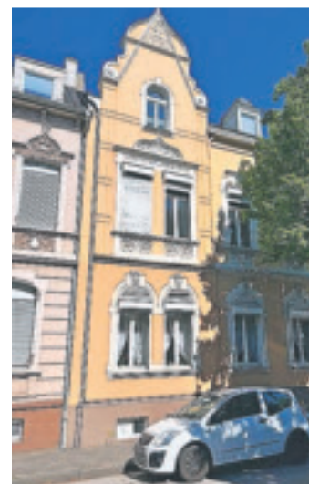
Wohnhaus von Wilhelm Wilden

Das Wohnhaus von Wilhelm Wilden an der Süchtelner Straße überzeugt durch seine bauliche Qualität. Der Historismus war nach dem 2. Weltkrieg lange Zeit in der Denkmalpflege als rückwärts orientierte Architektur verpönt. Heute weiß man seine Qualitäten zu schätzen: Die Handwerker waren gut ausgebildet und Baumaterialien erschwinglich. Vollholztüren und Stuckdecken wären heute für den „Häuslebauer“ unbezahlbar, um 1900 waren sie Standard.