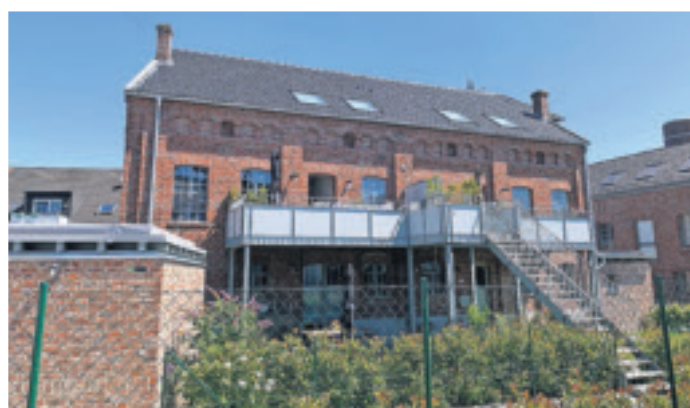
Ehemalige Gerberei und Lederfabrik August Henrichs an der Eichenstraße