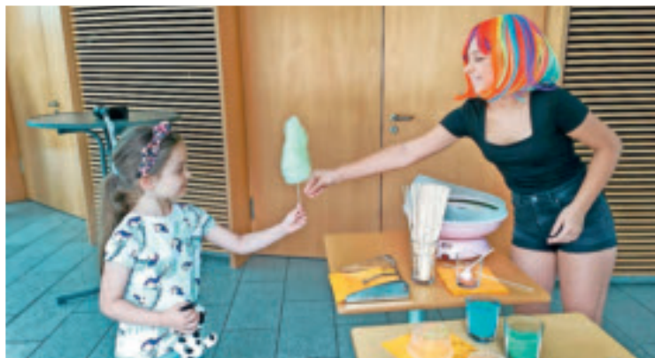
Besonders beliebt bei den Kids: der Zuckerwatte-Stand.