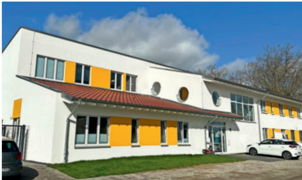
Nachhaltig: Die KiTa am Rintger Bach ist ganz aus Holz.

Das Jahresergebnis von gut 1,67 Millionen Euro lag erneut über dem Vorjahr und ist ebenfalls ein Höchstwert. Auch die anderen Geschäftsdaten haben sich sämtlich positiv entwickelt. Die Bilanzsumme stieg auf fast 146 Millionen Euro, Leerstand gibt es so gut wie nicht mehr