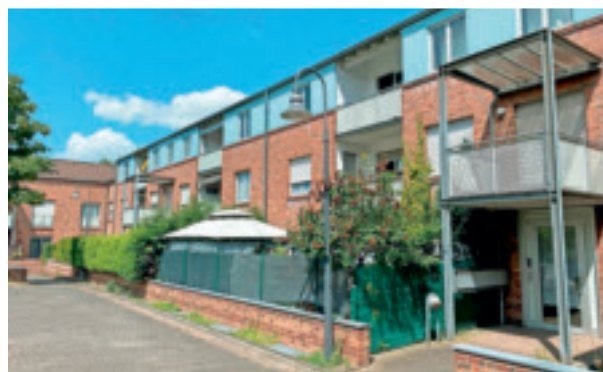
80er Jahre Klosterstraße