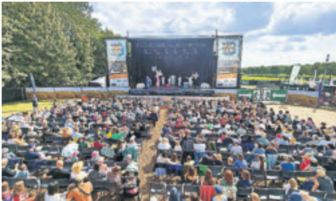
Da war die (Sommer-)Welt noch in Ordnung: Das Junge Theater Bonn brachte sein Stück vom „Neinhorn“ bei strahlendem Sonnenschein zur Aufführung.

Ohne sie gäbe es keine Sommerbühne: Hauptsponsor NEW und die zahlreichen weiteren Unternehmen aus Stadt und Region, die das Sommer-Programm auf dem Hohen Busch fördern: NEW AG, SAB Bröckskes, Sparkasse Krefeld, EA Elektro-Automatik, Matthias Schmitz Hausverwaltung, Waldhausen & Bürkel, Volksbank Viersen, WS Quack + Fischer, AGIS Industrie Service, Projekt 120 (Janissen & Janissen), Projekt 120 (Prangenberg & Zaum), KOHLSCHHEIN, MOStrom Elektronik, Hammer Mühle c/o MOStrom Elektronik, Solbach Verwaltung, Theo Lückner