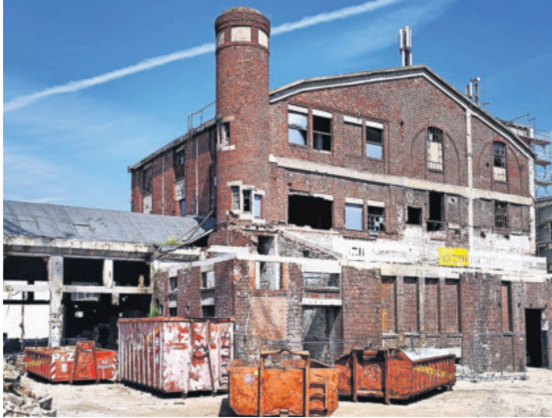
Papier- und Pappfabrik Heinrich Lehnen in Süchteln

Das Talent des Kontor- und Lagergebäudes der Samt- und Seidenweberei A. Weyermann Söhne in Dülken (Titelfoto) ist sein zeitgenössisch moderner, überörtlich typischer Baustil im Industriebau. Die Tradition des Unternehmens konnte seit seiner Firmengründung 1839 bis 2015 176 Jahre aufrecht gehalten werden. 1957 erhielt Paul Weyermann den Ehren-