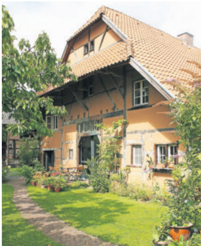
Der Tho-Rieth-Hof in Viersen-Hamm