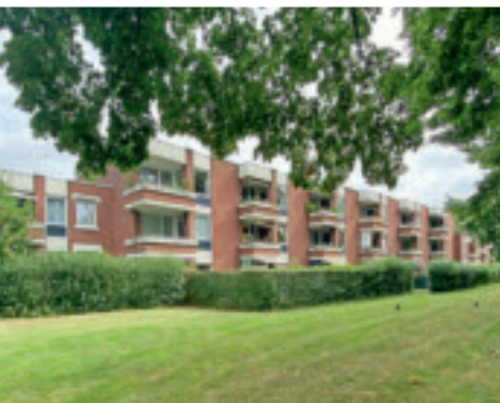
70er Jahre Beghinenhof