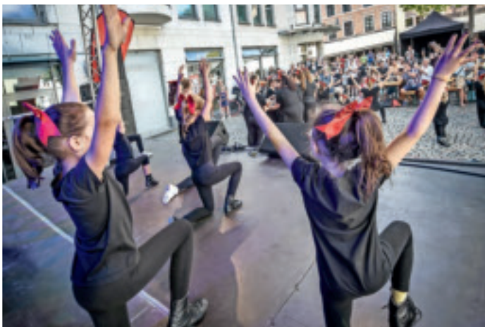
Für Unterhaltung sorgt beim Süchtelner Irmgardisfest am 9. und 10. September ein Bühnenprogramm.