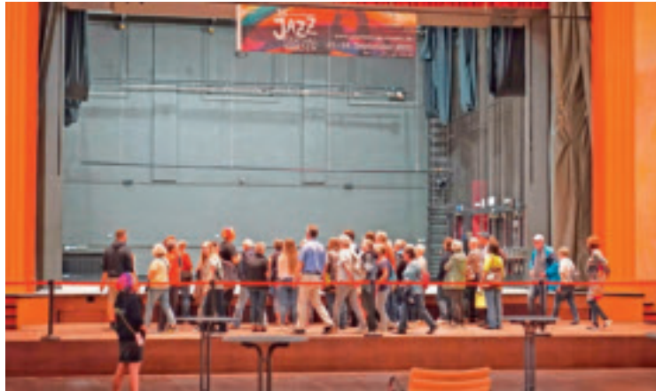
Wer einmal auf der Bühne der Festhalle stehen wollte, konnte sich diesen Wunsch beim Tag der offenen Tür erfüllen.

Die vielfältigen Angebote am Tag der offenen Tür in der Viersener Festhalle am Samstag, 12. August 2023, regten zahlreiche Interessierte zu einem Besuch in Viersens guter Kultur-Stube an. Unter fachkundiger Führung konnte hinter die Kulissen geblickt werden. Es gab Versteigerungen für einen guten Zweck, Live-Musik und Kinder-Aktionen. Ausschnitte aus Original-Produktionen der kommenden Spielzeit rundeten das Programm ab