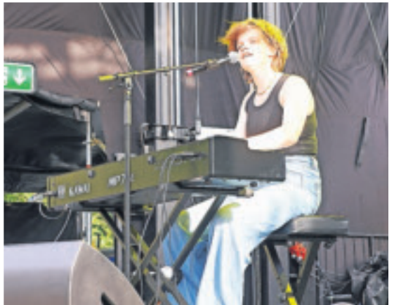
A Star is born? Die 17-jährige Singer-Songwriterin Songs of Sophie gewann mit toller Stimme den Viersener Bandcontest „Young Talents“.

Sie ließen sich vom Regen keinen Strich durch die (Kunst-)Rechnung machen: wasserfeste kunstinteressierte Gäste der Ausstellungseröffnung „Brennstoff“.