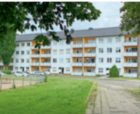
50er Jahre Dechant-Stroux-Straße