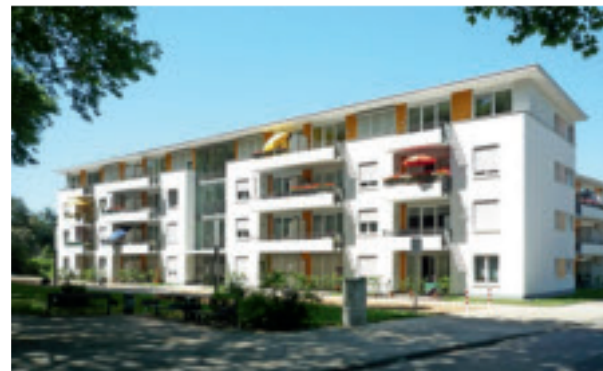
2010 Rahser Terrassen