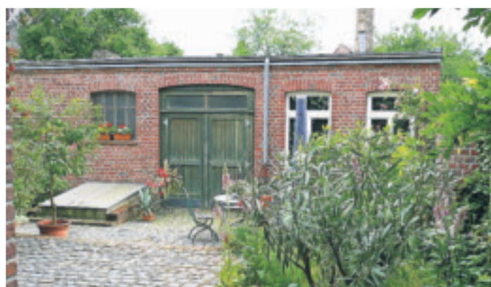
Ehemalige Weinbrennerei Fausten im Rahser