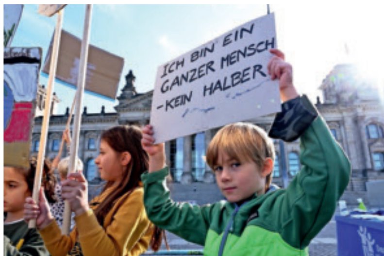
Am 20. September ist Weltkindertag in Viersen. Das Bild entstand bei einer Weltkindertagsaktion von Deutschem Kinderhilfswerk und UNICEF.