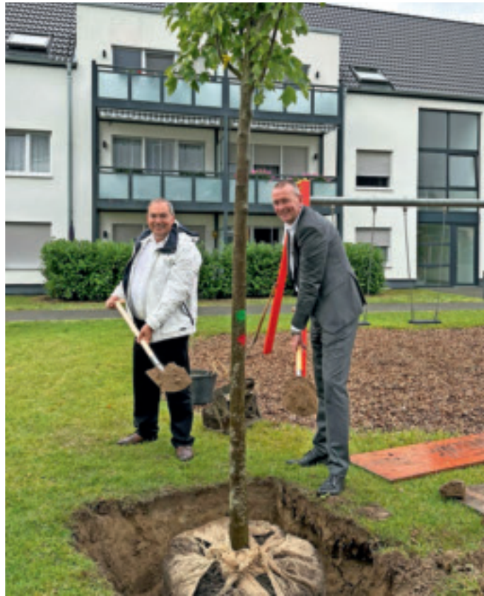
Zukunft schaffen: Bäume als ökologischer Ausgleich.