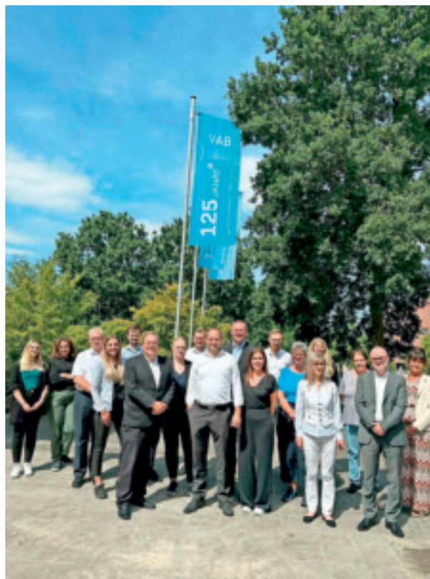
Klein und effektiv: Das VAB-Team heute.