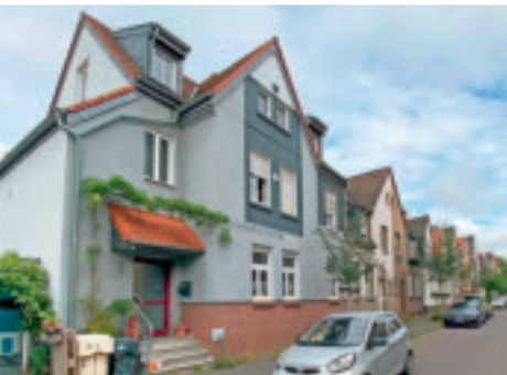
20er Jahre Regentenstraße