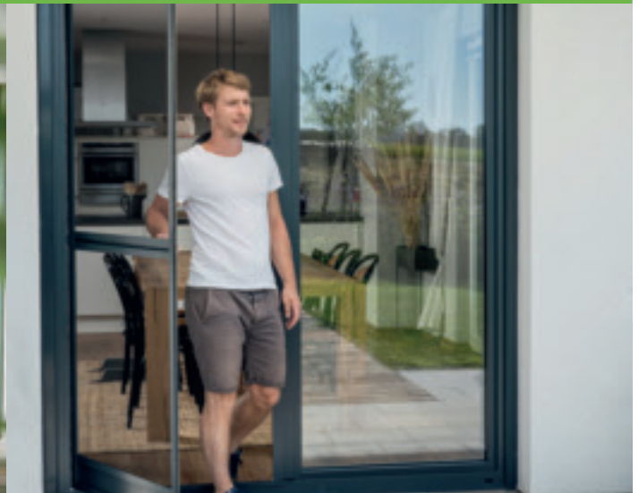
Pendeltüre nach Maß