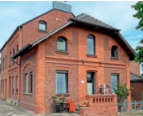
1898 erstes Haus