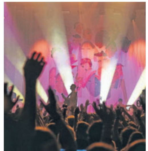
Milow musste nach Unwetterwarnung kurzfristig in die Festhalle ausweichen. Dort erlebte ein begeistertes Publikum einen Gänsehautauftritt des belgischen Popbarden.