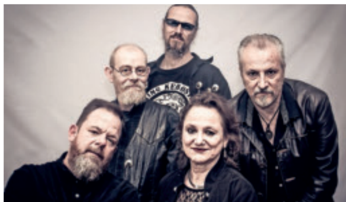
Blues, Rock, Country und Tex Mex: Die Bucket Boys gastieren am 2. September in der Königsburg in Süchteln.

Gemeinde St. Marien, Telefon 02162 5785093, st-remigius.de