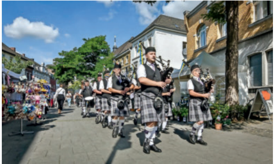
Die White Hackle Pipes and Drums sorgen beim Irmgardisfest in Süchteln für Stimmung.

Noch im August ist das Dülkener Mühlenfest zu nennen. Am (verkaufsoffenen) Sonntag, 27. August , bietet das Citymanagement in der #Sommerzone Dülken Aktionen für Kinder an. Es wird Kinderschminken geben. Eine Pflanzaktion steht auf dem Programm, bei der die Kinder anschließend das Ergebnis mit nach Hause nehmen können. Wer mag, kann mit Bauklötzen aktiv werden. Und Kinder, die gar keine Lust auf „Action“ haben, können sich einfach in den großen Sandkasten setzen und zum Beispiel eine Sandburg bauen. Die #Sommerzone ist eine Aktion des Citymanagements als Teil von „Viersen blüht“ in Zusammenarbeit mit Gartenbau Jansen.