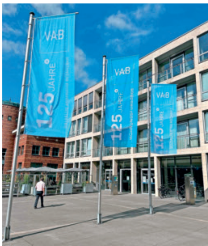
Die VAB feiert „125 Jahre“ und zeigt dies mit Fahnen und Luftballons vor dem Stadthaus Viersen.

Neben der Wohnungsfürsorge engagiert sich die VAB seit Jahren aber auch immer stärker beim Ausbau der sozialen Infrastruktur in Viersen.