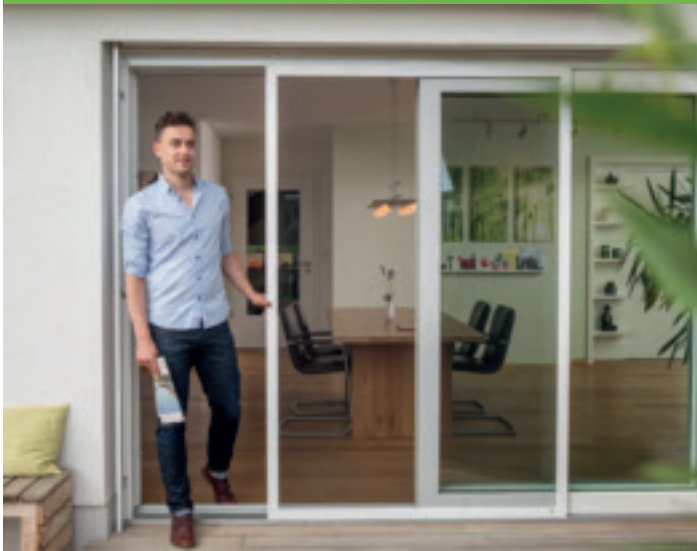
Schiebetüre zum Öffnen