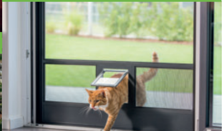
Für alle Hausbewohner geeignet