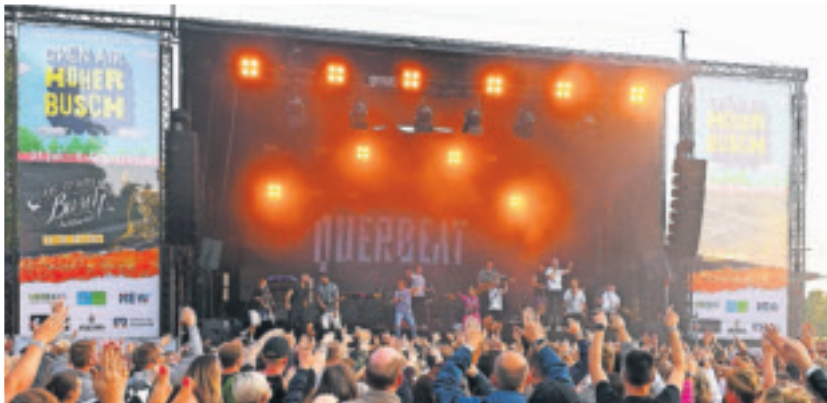
Einen Sommerbühnen-Auftakt nach Maß bot die 13-köpfige Brassbeat-Combo Querbeat. Viersen tanzte und feierte die Band ausgelassen.

Ohne sie gäbe es keine Sommerbühne: Hauptsponsor NEW und die zahlreichen weiteren Unternehmen aus Stadt und Region, die das Sommer-Programm auf dem Hohen Busch fördern: NEW AG, SAB Bröckskes, Sparkasse Krefeld, EA Elektro-Automatik, Matthias Schmitz Hausverwaltung, Waldhausen & Bürkel, Volksbank Viersen, WS Quack + Fischer, AGIS Industrie Service, Projekt 120 (Janissen & Janissen), Projekt 120 (Prangenberg & Zaum), KOHLSCHHEIN, MOStrom Elektronik, Hammer Mühle c/o MOStrom Elektronik, Solbach Verwaltung, Theo Lückner