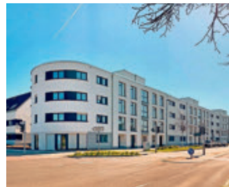
2022 Cityline Appartements Brüsseler Allee